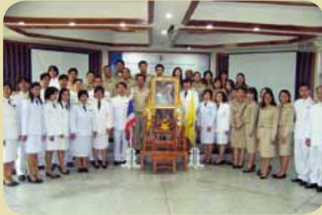
กมก.๗๓ 7 อุตรธานี