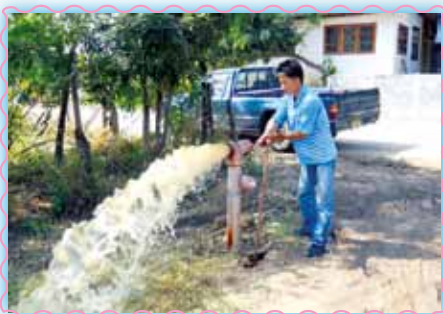
สถานที่ 57 สภาสุวรรณภูมิ

ระดมระดมทุนแล้วแถมเพิ่มพลัง เพื่อเตรียมพร้อมป้องกันภัยภัย รับชำระค่าน้ำประปา จัดทำสัญญาใหม่เพื่อรับข้อมูลลูกค้าในทุกรัฐ แจกน้ำดื่มเย็นน้ำใจเล็ก ๆ แก่ผู้ประสบภัยน้ำท่วม