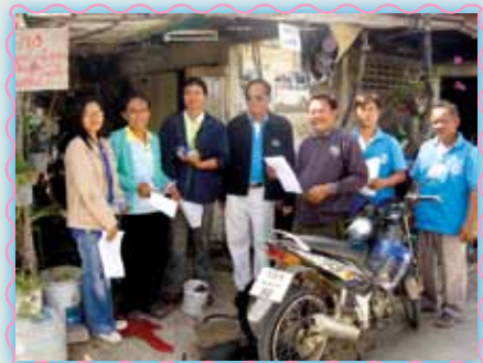
สาขาที่ 9 สาขามันไม้