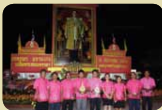
กม.ก.สภาลาดขวาง