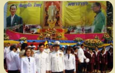
กมก.สาขามางสะพาน