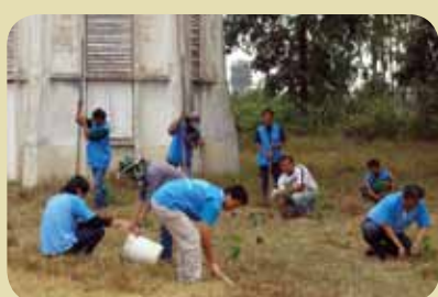
กม.ก.สัทธามนาสารตาม