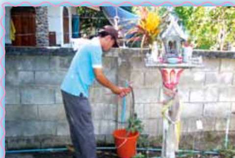
สถานที่ 37 สาทชอด