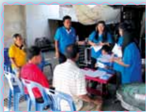
สาขาที่ 43 สาขานองเต