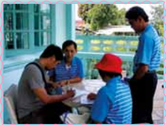
สาขาที่ 38 สาขาคลองใหญ่