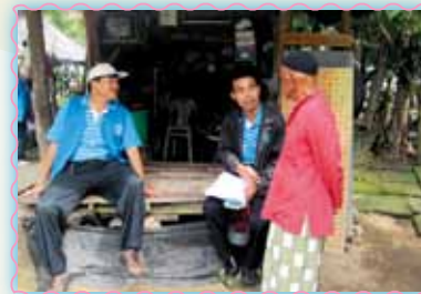
สาขาที่ 39 สาขานราธิวาส