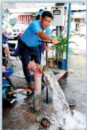
สถานที่ 53 สภามลบุรี (พิพิธ)