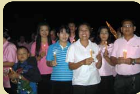
กม.ก.สภาชัยภูมิ