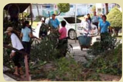
กม.ก.สัทธาพนมรุ้