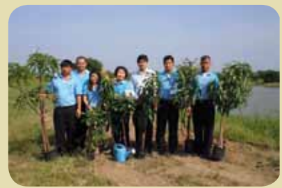
กม.ก.สัทธามางปะกง