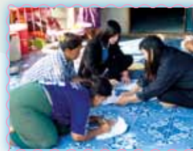
สาขาที่ 45 สาขาสุพรรณบุรี