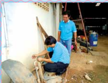
สถานที่ 25 สภาสวดโลก