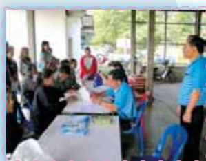
สาขาที่ 46 สาขาชุมแพ

รับทำพิธีน้ำประปาใหม่เพิ่มความสะอาดในลูกดัก ลดเวลาในการเดินทาง