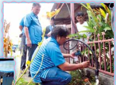
สถานที่ 27 สภาหนองไม้