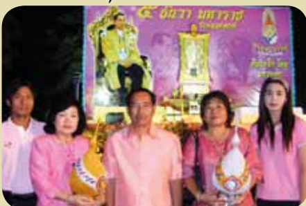
กมก.สาขาอุททอง