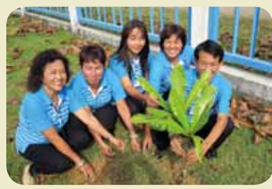
กม.ก.สัทธาธราด