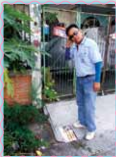
สถานที่ 29 สาทรังสิต (พิเณร)