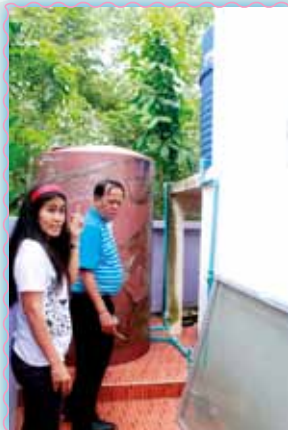
สาขาที่ 8 สาขาสุราษฎร์ธานี