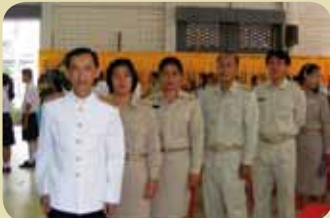
กมก.สาขาคลองใหญ่

เนื่องในโอกาสวันเฉลิมพระชนมพรรษา 83 พรรษา 5 ธันวาคมนาราช การประชาสัมพันธ์ภาคสาขาต่าง ๆ พร้อมใจถวายพระพร และประกอบกิจกรรมเพื่อถวายแด่พระบาทสมเด็จพระเจ้าอยู่หัว