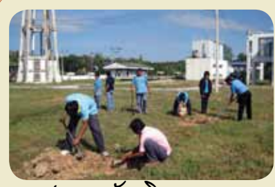
กม.ก.สัทธาฉัญภูมิ