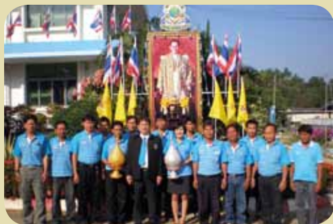
กม.ก.สภาน้ำพอง