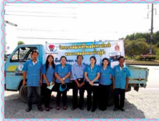
สาขาที่ 2 สาขามันฉาง