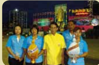
กมก.สาขาตราด