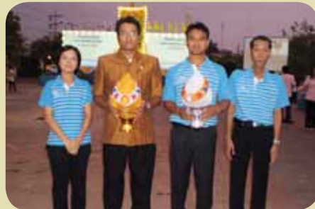
กมก.สาขามุกษานี