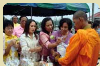
กม.ก.สัทธาสุราษฎร์ธานี