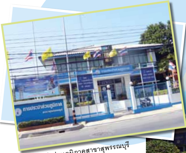
การประปาส่วนภูมิภาคสาขาสุพรรณบุรี