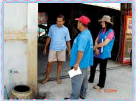
สาขาที่ 4 สาขาทิมาย