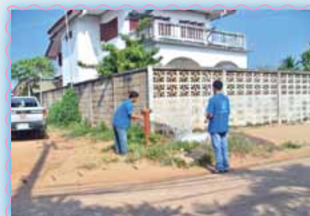
สถานที่ 60 สภาไร่สีนวล