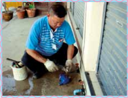
สถานที่ 20 สภาอเนกมณฑล