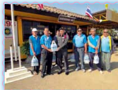
สถานที่ 18 สากนลุ่มสัก