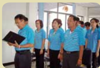
กม.ก.สภาพะเยา