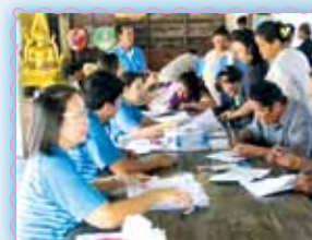
สาขาที่ 52 สาขาพิจิตร