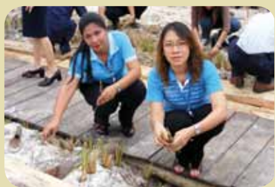
กม.ก.สัทธาคลองใหญ่