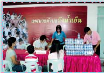
สถานที่ 54 สภาสระแก้ว