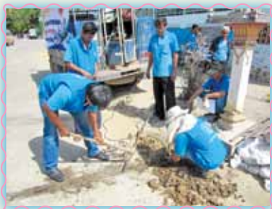
สถานที่ 28 สาทอ่างทอง