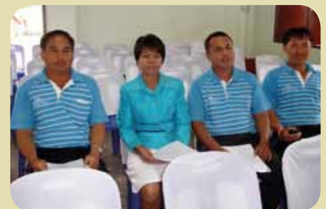
กมก.สาขาพนอม