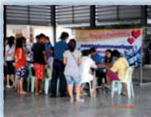
สาขาที่ 44 สาขาพระนครคีรี