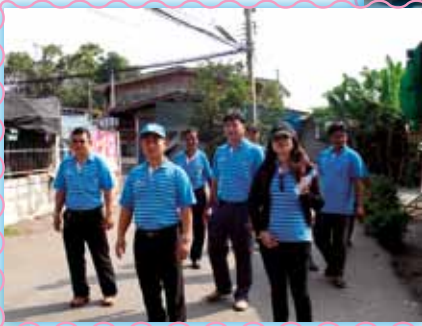
สาขาที่ 5 สาขาสวนผึ้ง