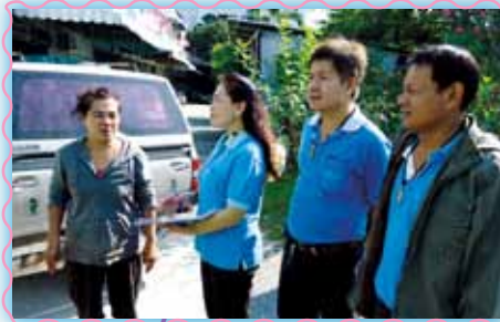
สาขาที่ 6 สาขาสัมพราน