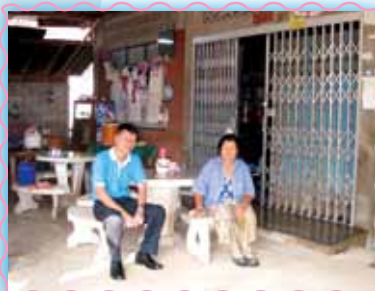
สถานที่ 15 สากอุตรดิตถ์