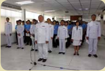
กมก.๗๓ 1 ชลบุรี