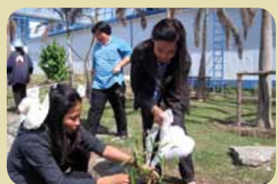
กม.ก.สัทธาแหลมฉมัง