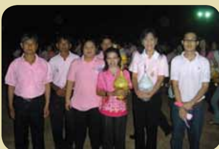
กม.ก.สภานครไทย