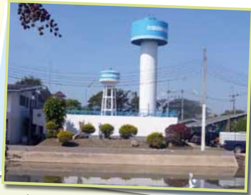
การประปาส่วนภูมิภาคสาขาแม่สอด