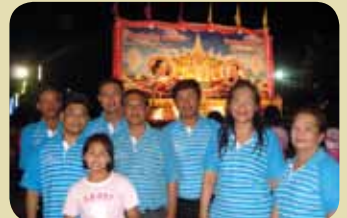
กมก.สาขาท่าเรือ