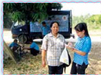
สาขาที่ 41 สาขาท่าตะโก