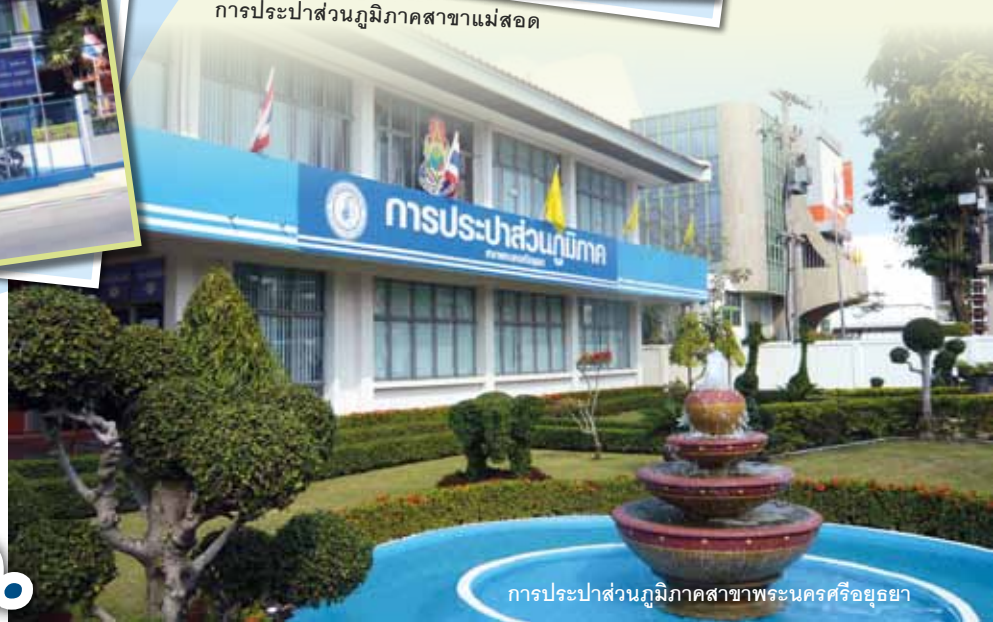
การประปาส่วนภูมิภาคสาขาพระนครศรีอยุธยา