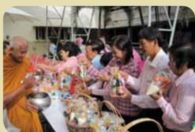
กม.ก.สัทธาตรนาวก