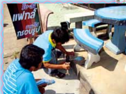
สถานที่ 26 สภาชนแดน