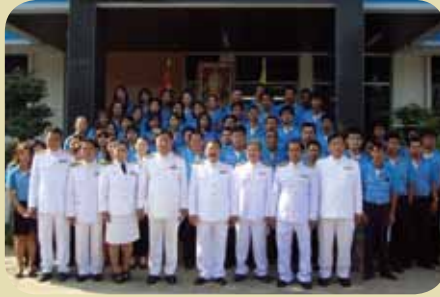
กมก.๗๓ 3 ราชบุรี