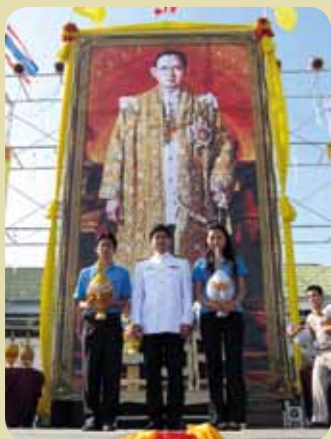
กม.ก.สภามณฑลพะเยา