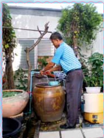
สถานที่ 34 สาทนาภะภ

ตรวจซ่อมอุปกรณ์ระมณการในม้านในฟรี ทั้งก้อกน้ำ ชักโครก ฝักมั่ว อ่างล้างหน้า