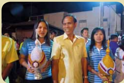
กม.ก.สภาพลู