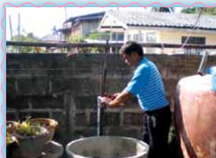
สถานที่ 36 สาทน้ำพอง