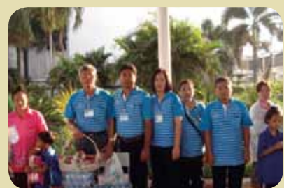
กม.ก.สัทธาพนสนธิ์