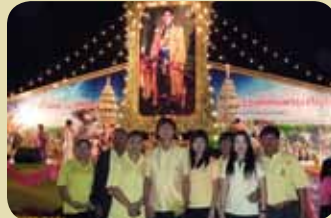
กมก.สาขามันฉาง