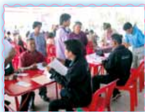
สาขาที่ 47 สาขาเมืองพล