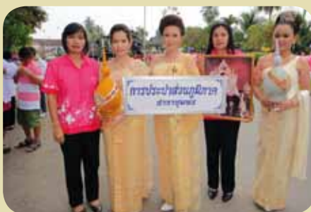
กม.ก.สภาชุมพร