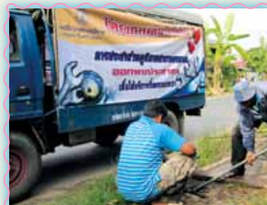
สถานที่ 30 สาทนตนาขก