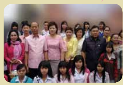
กม.ก.พธ 7 อุตรธานี