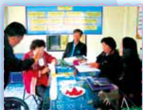
สาขาที่ 50 สาขาพาน