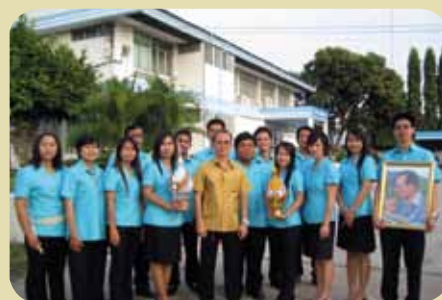
กม.ก.สภาสุรินทร์