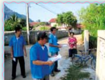
สาขาที่ 42 สาขาทุ่งเสลี่ยม