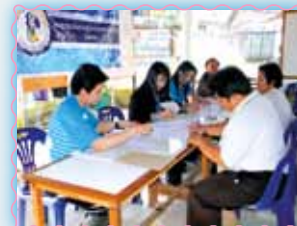
สาขาที่ 49 สาขาเชิงใหม่ (พิบูลย์)