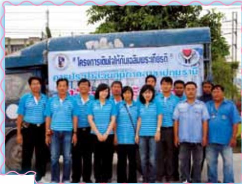
สาขาที่ 3 สาขามุกษานี