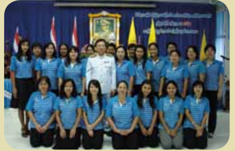
กมก.๗๓ 4 สุราษฎร์ธานี