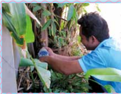
สถานที่ 23 สภาจุน