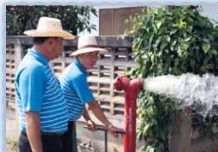
สถานที่ 58 สภาเกาะตา