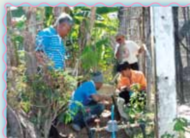
สถานที่ 33 สาทมนาธนะชัย