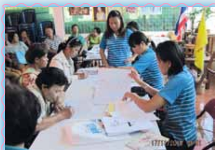
สถานที่ 59 สภามะลิ