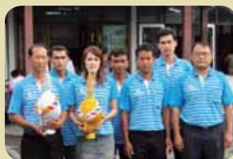
กม.ก.สภานครศรีธรรมราช