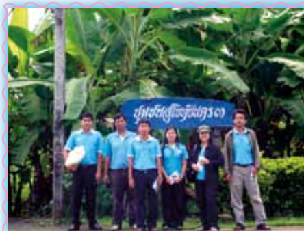
สถานที่ 13 สากสุโก้ง