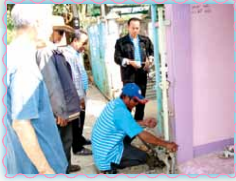
สถานที่ 21 สภาท่าเรือ