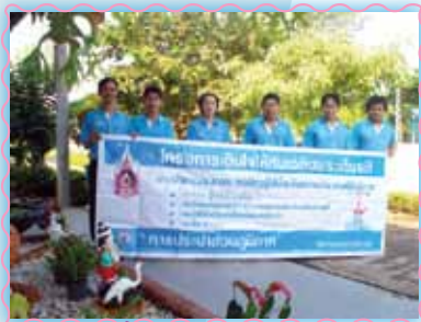
สถานที่ 12 สากแม่จาง