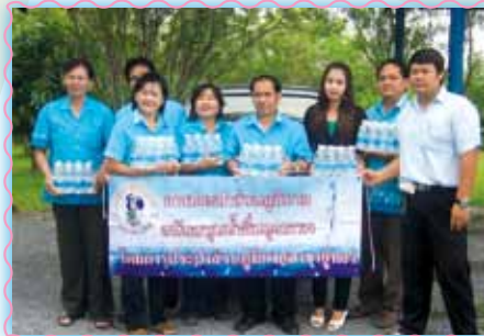
สถานที่ 55 สภาอุทุม