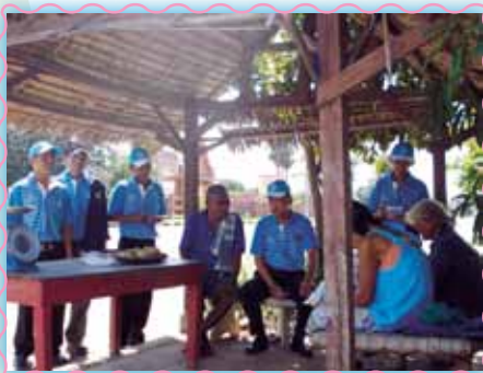
สาขาที่ 7 สาขาลาพัว