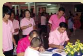
กม.ก.สภาทอกรักษ์กันบุรี