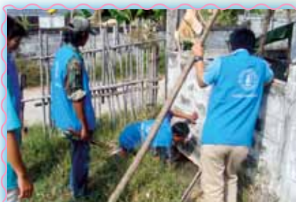
สถานที่ 32 สาทมนาสารตาม