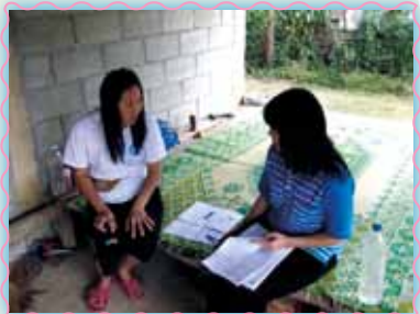
สาขาที่ 40 สาขาเวียงเชียงพอง