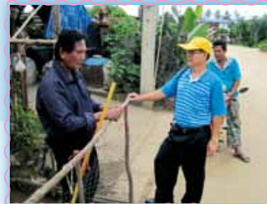
สถานที่ 14 สากไร่สำโรง