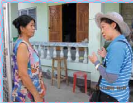
สถานที่ 11 สากนันทโฮง