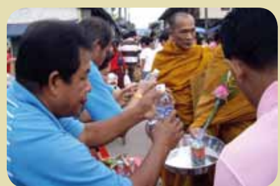
กม.ก.สัทธามัทนาสาร