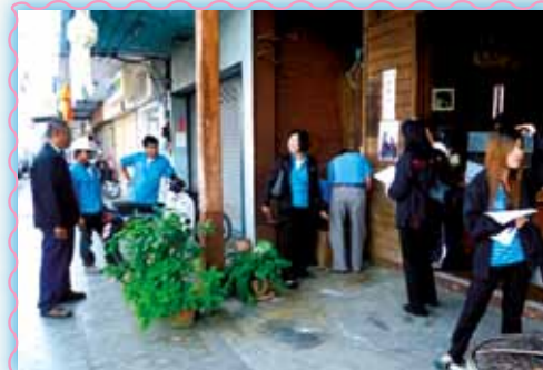
สถานที่ 24 สภาเชิงราช