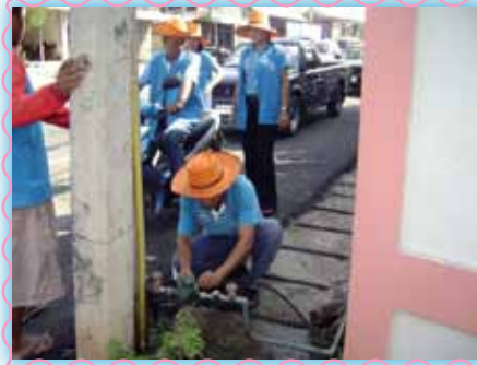
สถานที่ 22 สภาทุ่งเือง

ตรวจสอบมาตรฐาน ในอยู่ในสถานที่ใช้งานได้ดี