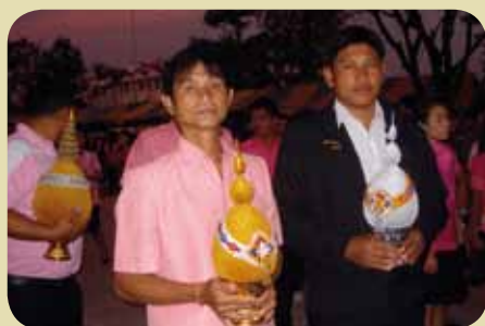
กม.ก.สภานองนาคแดง