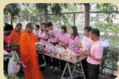
กม.ก.สัทธามักก้อ