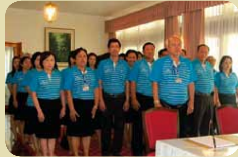
กมก.๗๓ 9 เชียงใหม่