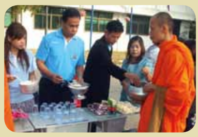
กม.ก.สัทธาท่าทะโก