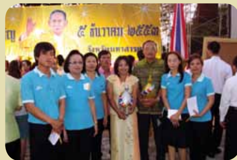
กม.ก.สภามหาสารคาม