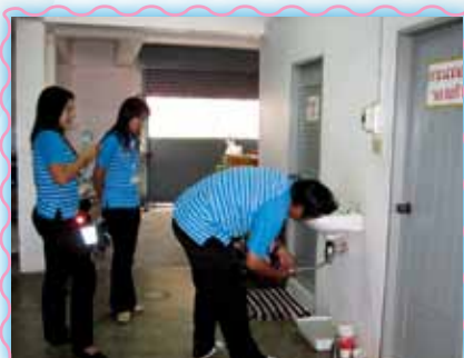
สถานที่ 35 สาทลุม