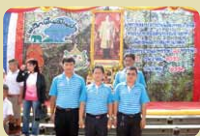
กม.ก.สัทธาฉนวนัง