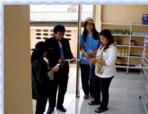
สถานที่ 16 สากนางมูลนา