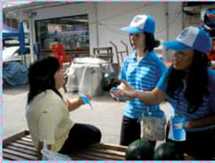
สาขาที่ 1 สาขาตาก (พิเศษ)

พบปะพูดคุย ให้ความรู้เรื่องการดูแลและบริหารในร้าน ร้านทั้ง ๙ ร้าน สร้างความผูกพัน