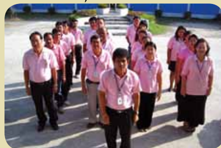
กมก.สาขาอ้อมน้อย