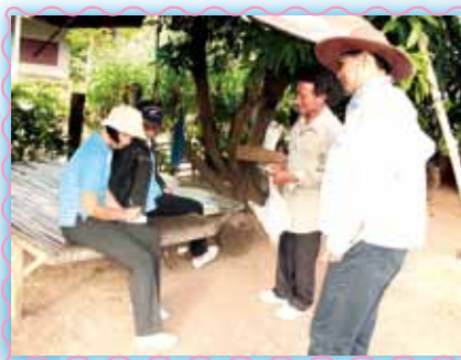
สถานที่ 19 สากอึ้งมูรี