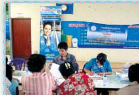
สถานที่ 56 สภาชัยภูมิ