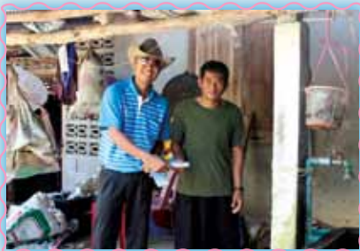
สถานที่ 10 สากผาง