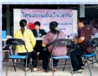
สาขาที่ 51 สาขาแม่สาย