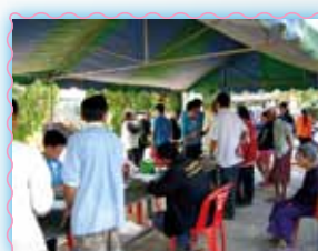
สาขาที่ 48 สาขานองน้ำแดง