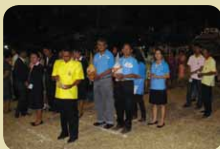
กม.ก.สภานองไผ่