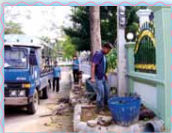
สถานที่ 31 สาทกาณจนบุรี

ต้นน้ำน้ำไว้ในลิในระมณกันท้อ พร้อมซ่อมแซมในักันที่ ทั้งในม้านและนอกม้าน