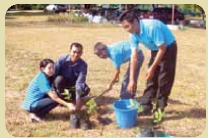
กม.ก.สัทธาวัฒนานคร