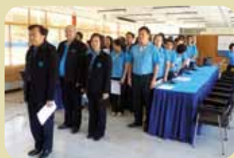
กม.ก.สภาเชียงราย