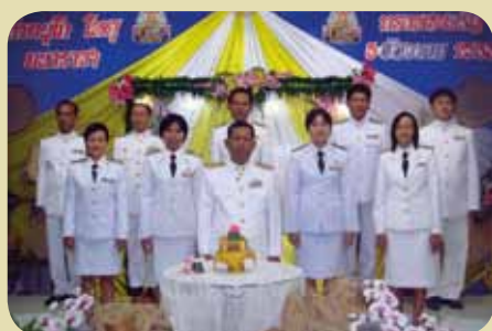
กม.ก.สภาแม่สอด