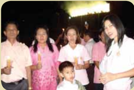
กมก.สาขาตรมรี