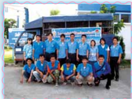
สถานที่ 17 สากเพชรบูรณ์