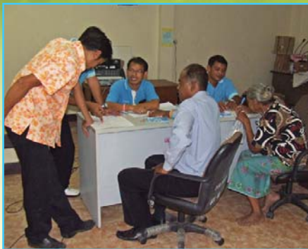
สาขาที่ 78 สาขาห้วยยอด