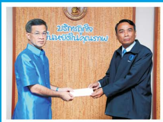
กปภ. สาขาพิทยา รางวัลนวัตกรรมช่องทางด่วนชำระค่าน้ำประปา