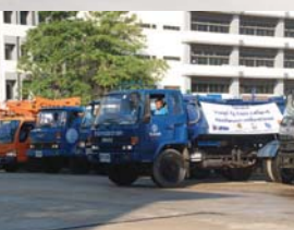
พิธีปล่อยน้ำเปิดโครงการราษฎร์ รัฐ ร่วมใจ ช่วยภัยแล้ง ให้ความช่วยเหลือผู้ประสบภัยแล้งทั่วประเทศ