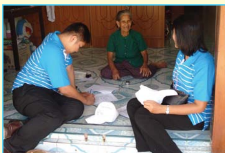
สาขาที่ 74 สาขาไชยา