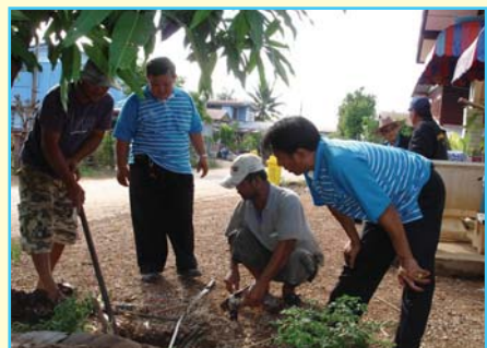
สาขาที่ 103 สาขาวิเชียรบุรี