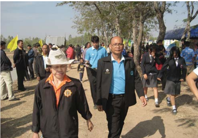
การประปาส่วนภูมิภาคสาขาหนองคาย ร่วมกิจกรรมการจัดตั้งศูนย์เรียนรู้โครงการอันเนื่องมาจากพระราชดำริ อ.มหาชนะชัย ณ รร.บ้านขาม อ.มหาชนะชัย จ.ยโสธร