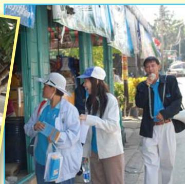
สาขาที่ 62 สาขามวกเหล็ก