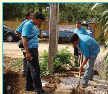
สาขาที่ 102 สาขาหนองไผ่