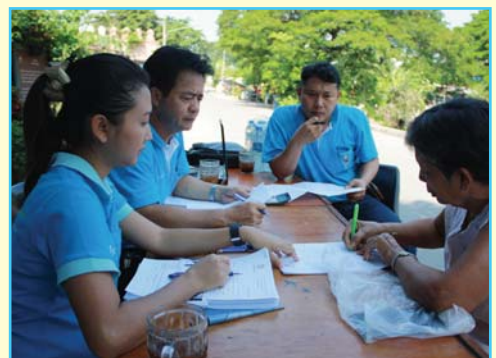
สาขาที่ 63 สาขาลพบุรี