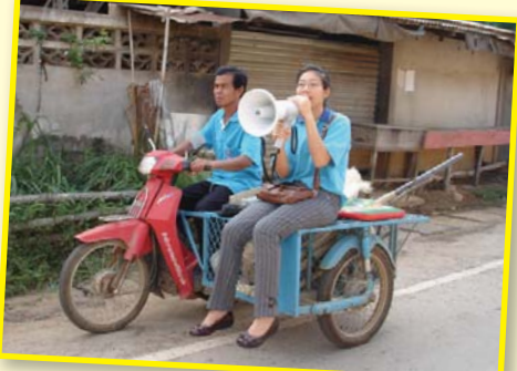
สาขาที่ 100 สาขาศรีสัชนาลัย