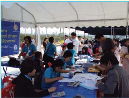
สาขาที่ 92 สาขาแม่ริม