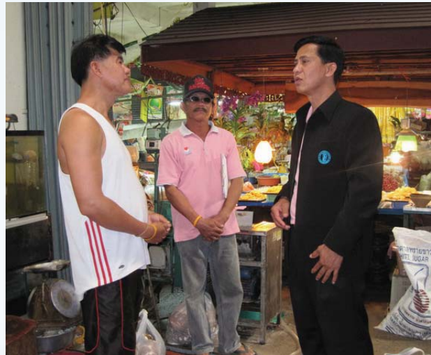
ก็เจง การประปาส่วนภูมิภาคสาขาฉะเชิงเทรา ออกไปพบประชาชนในตลาดท่ามะเขือ ซึ่งแจ้งการปรับปรุงเปลี่ยนท่อเมนรองเดิมซึ่งมีสภาพผุกร่อน เพื่อลดอัตราการน้ำสูญเสีย เมื่อวันที่ 25 มกราคม 2553