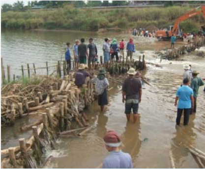
การประปาส่วนภูมิภาคสาขาพรรคโลก ร่วมกับองค์การบริหารส่วนตำบลวังไม้ขอน จัดทำฝายน้ำล้นเพื่อกักเก็บน้ำในแม่น้ำยมบริเวณด้านใต้โรงสูบน้ำแรงต่ำของแม่ข่ายพรรคโลก

สำหรับ กปภ.สาขาที่ไม่มีน้ำดิบเหลือเพียงพอในการผลิตน้ำประปาเพื่อแจกจ่ายให้ใช้บรรทุกน้ำไปรับน้ำประปาจากสาขาใกล้เคียงเพื่อนำไปแจกจ่ายให้แก่ประชาชนที่ได้รับความเดือดร้อน ซึ่ง กปภ.ทั้ง 230 สาขาจะประชาสัมพันธ์สถานการณ์น้ำดิบให้ประชาชนในพื้นที่รับทราบอย่างต่อเนื่อง ทั้งนี้ ต้องขอความร่วมมือประชาชนให้ช่วยกันประหยัดน้ำและจัดเตรียมภาชนะเพื่อเก็บสำรองน้ำไว้ใช้ในช่วงฤดูแล้ง