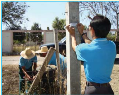
สาขาที่ 93 สาขาแม่แตง