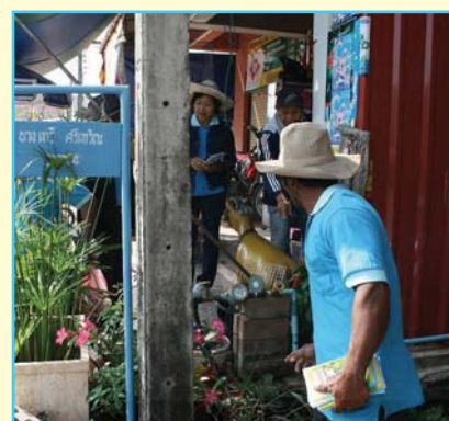
สาขาที่ 86 สาขาบ้านดุง