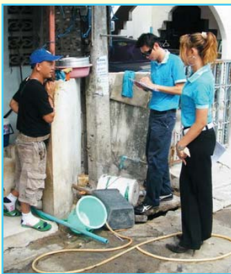
สาขาที่ 58 สาขาระยอง

กปภ. เต็มใจส่งใจถึงบ้าน ในกิจกรรม “เต็มใจให้กัน” ปี 2553 สาขาที่ 58 ถึง 103