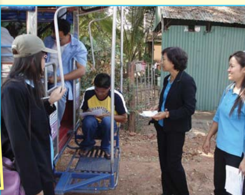
สาขาที่ 85 สาขาชุมพลบุรี