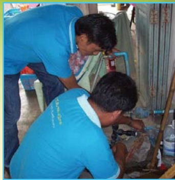
สาขาที่ 79 สาขาสายบุรี