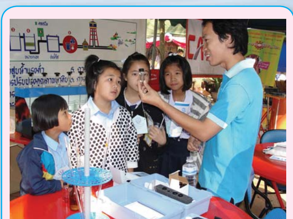
การประปาส่วนภูมิภาคสาขาแม่สาย ร่วมจัดนิทรรศการให้ความรู้เรื่องน้ำประปาพร้อมให้การสนับสนุนน้ำดื่ม จำนวน 150 ขวด ในกิจกรรมวันวิชาการเทศบาลตำบลแม่สาย ครั้งที่ 2 เมื่อวันที่ 12 กุมภาพันธ์ 2553