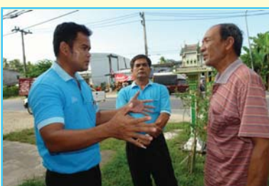
สาขาที่ 75 สาขาตะกั่วป่า