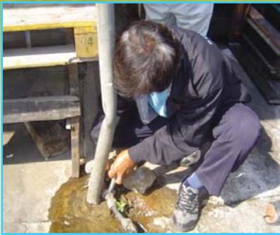
สาขาที่ 64 สาขาอ่างทอง