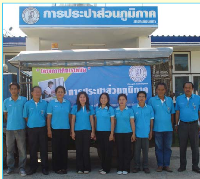
สาขาที่ 88 สาขาเลิงนกทา