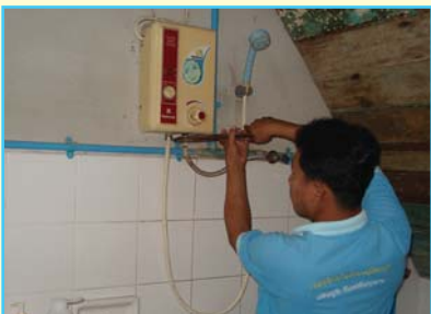
สาขาที่ 70 สาขาเดิมบางนางบวช