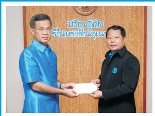
กปภ. สาขาสินค้าแพง รางวัลนวัตกรรมลดน้ำสูญเสีย