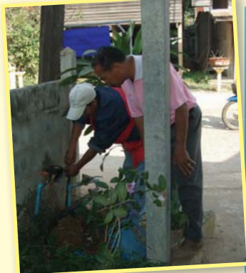
สาขาที่ 84 สาขามหาสารคาม