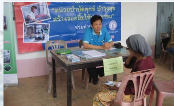
บำบัดทุกข์ บำรุงสุข การประปาส่วนภูมิภาคสาขาสละงูร่วมกิจกรรมอำเภอละงูเยี่ยมเคลื่อนที่ “หน่วยบำบัดทุกข์ บำรุงสุข สร้างรอยยิ้มให้ประชาชน” ณ โรงเรียนบ้านบากันโต๊ะตัด หมู่ 7 ต.ละงู อ.ละงู จ.สตูล เมื่อวันที่ 19 พฤศจิกายน 2552