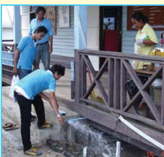
สาขาที่ 73 สาขากาญจนดิษฐ์