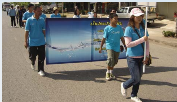
กีฬา การประปาส่วนภูมิภาคสาขาศรีเชียงใหม่ ร่วมกิจกรรมกีฬาสถาบันการเงินและรัฐวิสาหกิจสัมพันธ์ ประจำปี 2552 เมื่อวันที่ 21 พฤศจิกายน 2552