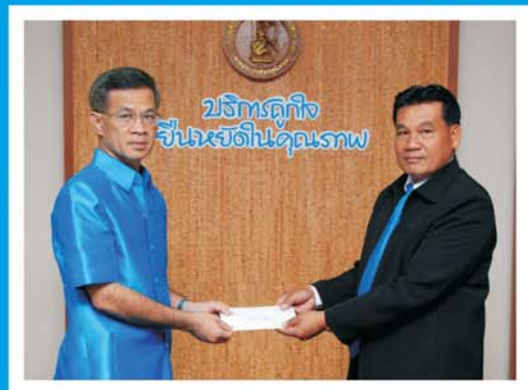
กปภ. สาขาสกนกร รางวัลนวัตกรรมควบคุมการผลิต และจ่ายน้ำด้วยโทรศัพท์มือถือ