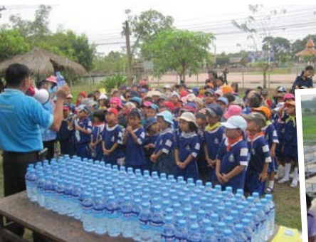
การประปาส่วนภูมิภาคสาขาพิษณุโลก คณะครูและนักเรียน

รร.เทศบาลพรหมพิรามอุทิศ ชั้นอนุบาลปีที่ 1 และ 2 จำนวน 170 คน เข้าทัศนศึกษา ระบบผลิต ที่หน่วยบริการพรหมพิราม เมื่อวันที่ 22 มกราคม 2553 และคณะอาจารย์ และนักศึกษา คณะสถาปัตยกรรมศาสตร์ มหาวิทยาลัยนเรศวร จำนวน 40 คน เยี่ยมชมกระบวนการผลิต น้ำประปา เมื่อวันที่ 20 กุมภาพันธ์ 2553