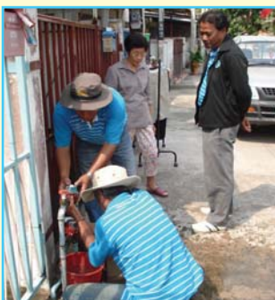
สาขาที่ 98 สาขาชัยนาท