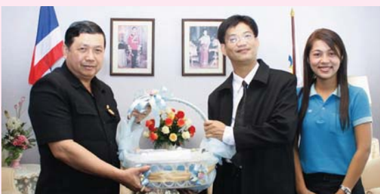
สัมพันธ์ก็สุข การประปาส่วนภูมิภาคเขต 1 มอบของขวัญแก่ผู้มีอุปการคุณ อาทิ ผู้ว่าราชการจังหวัดชลบุรี ผู้ว่าราชการจังหวัดระยอง ผู้บัญชาการตำรวจภูธรภาค 2 นาย กอบจ.ชลบุรี นายกเมืองพัทยา ผู้อำนวยการแขวงทางจังหวัดชลบุรี กรมชลประทานที่ 9 อัยการจังหวัดชลบุรี อัยการคดีแพ่งและแรงงาน และศาลแขวงจังหวัดชลบุรี เป็นต้น