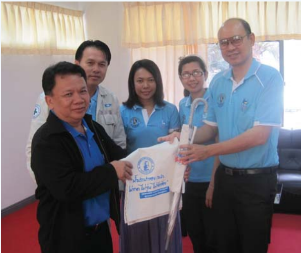
แต่ผู้ถือการคุณ การประปาส่วนภูมิภาคสาขาสมุทรสาคร นำของที่ระลึกประกอบด้วย กระเป๋าดำลวดโลกกร้อน และร่มกันฝนตราสัญลักษณ์ กปภ. มอบให้กับผู้ใช้น้ำและผู้มีอุปการคุณ ที่มีส่วนให้ความช่วยเหลือกิจกรรม กปภ. ด้วยดีมาโดยตลอด