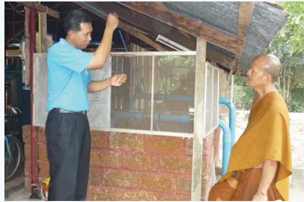
แผนก การประปาส่วนภูมิภาคเขต 8 ให้คำแนะนำด้านระบบผลิตน้ำประปาแก่วัดหนองป่าพง (วัดหลวงปู่ชา สุภัทโท) อ.วารินชำราบ จ.อุบลราชธานี เมื่อวันที่ 28 ธันวาคม 2552 เพื่อสร้างสัมพันธ์ที่ดี