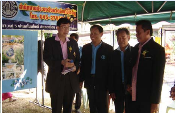
การประปาส่วนภูมิภาคสาขาอำนาจเจริญ ร่วมจัดนิทรรศการให้ความรู้ด้านการผลิตน้ำประปา ให้คำปรึกษาด้านระบบน้ำประปา พร้อมแจกเอกสารประชาสัมพันธ์ และของที่ระลึกให้กับประชาชนที่เข้าร่วมงานวันราชประชานุเคราะห์ ประจำปี 2553 เมื่อวันที่ 16 มกราคม 2553