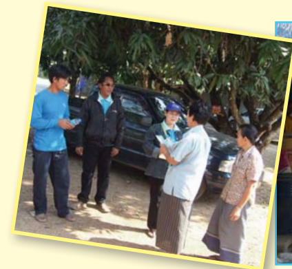
สาขาที่ 61 สาขากบินทร์บุรี