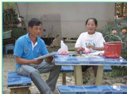
สาขาที่ 96 สาขาจุน