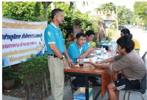
เต็มใจให้กัน การประปาส่วนภูมิภาคสาขาลพบุรี ออกพบผู้ใช้บริการบริเวณชุมชนถนนชนะสงคราม หมู่ 8 ต.ป่าตาล อ.เมือง จ.ลพบุรี เพื่อให้คำปรึกษาเรื่องน้ำประปา รวมทั้งรับคำขอติดตั้งประปา เมื่อวันที่ 12 พฤศจิกายน 2552