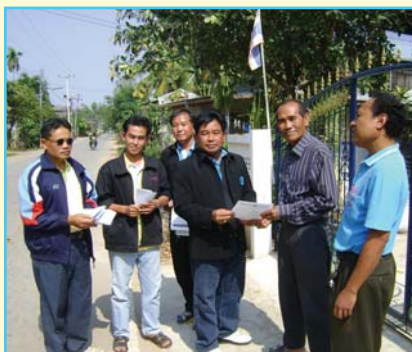
สาขาที่ 82 สาขากระนวน