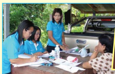
สาขาที่ 76 สาขาปากพนัง