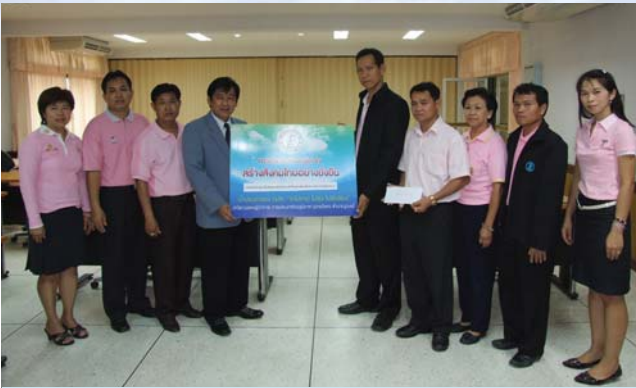
การประปาส่วนภูมิภาคเขต 8 มอบเงินให้กับศูนย์วิทยุการบิน จ.อุบลราชธานี เพื่อสนับสนุนเป็นทุนการศึกษาในการจัดซื้ออุปกรณ์กีฬาเพื่อคนพิการ และผู้ด้อยโอกาส เมื่อวันที่ 23 กุมภาพันธ์ 2553