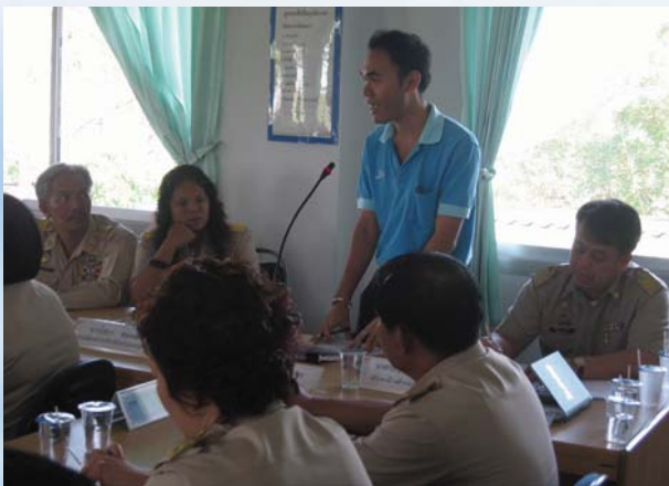
ประชุมสภา อบต. การประปาส่วนภูมิภาคเขต 1 และ สาขาบางปะกง ร่วมประชุมสภา อบต.บางปะกง ครั้งที่ 1/53 เรื่องขอให้ที่ดินสาธารณะประโยชน์คลองหัวจาก ม.13 อ.บางปะกง จ.ฉะเชิงเทรา เพื่อก่อสร้างสถานีจ่ายน้ำเพิ่มเติม โดยที่ประชุมมีมติเห็นชอบให้สามารถดำเนินการได้ เพื่อรองรับกับการขยายตัวของชุมชน และสามารถจ่ายน้ำให้กับประชาชนในพื้นที่ได้อย่างพอเพียงและทั่วถึง