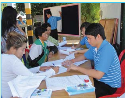
สาขาที่ 101 สาขาพิจิตร