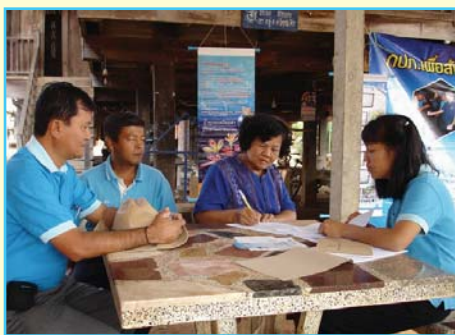
สาขาที่ 99 สาขาทุ่งเสลี่ยม