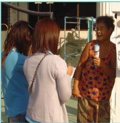
สาขาที่ 67 สาขาบ้านโป่ง