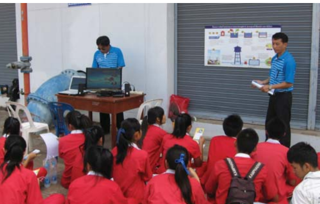
การประปาส่วนภูมิภาคสาขากำแพงเพชร คณะครูและนักเรียนโรงเรียนกำแพงเพชรพิทยาคม ระดับชั้น ม.5 กลุ่มสาระการเรียนรู้วิทยาศาสตร์ จำนวน 20 คน เข้าศึกษาดูงานระบบผลิตน้ำประปา บริเวณโรงกรองน้ำศูนย์ราชการ เมื่อวันที่ 4 กุมภาพันธ์ 2553