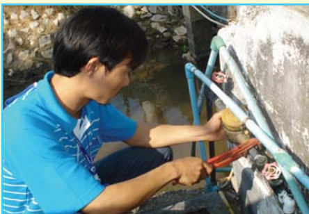
สาขาที่ 95 สาขาแม่ชะจาน