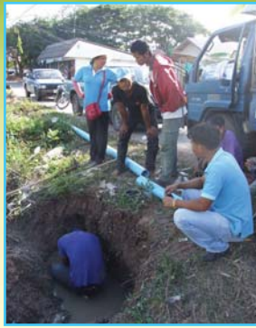
สาขาที่ 90 สาขาศรีสะเกษ