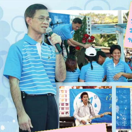
ปีนี้ "ใจสั่งมา" ปีหน้า "ชมซาน" มาแม่ ผู้ว่าฯ : หัวเราะอึ้งใจสุด

เซอร์ไพรส์ที่สุดของงานนี้เห็นจะเป็นช่วงที่ท่านผู้ว่า วิเศษของเราขึ้นไปร้องเพลง "ใจสั่งมา" ของพี่เสก โลโซ นี่แหละ บรรดาแม่ยกทั้งหลายส่งเสียงกรี๊ดกันเกรียวกราว ผลัดเปลี่ยนกันส่งมอบดอกไม้ช่อโตกันไม่ขาดสาย แถมท่าน ผู้ว่ายังทิ้งท้ายไว้ว่า "จะมาร้องเพลงชมซานให้ฟังอีกใน ปีหน้า"...อย่างนี้ครบรอบ 32 ปี กปภ. พลัดไม่ได้ซะแล้ว