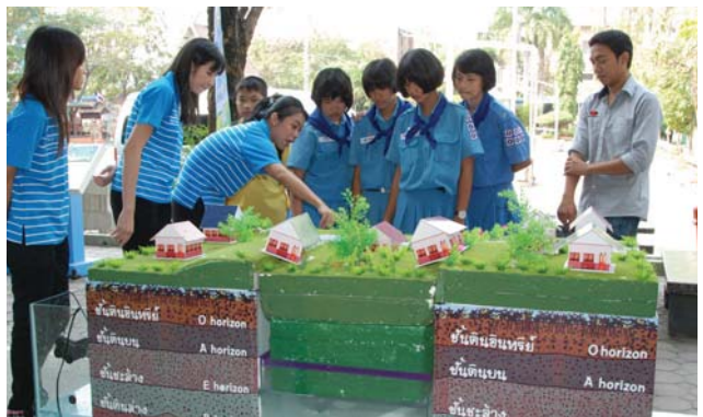
กิจกรรม กปภ.สัญจร ห่วงใยแผ่นดินรุด ... เล่าน้องให้บอกต่อ

“เล่าน้องให้บอกต่อ” ที่มีวัตถุประสงค์เพื่อปลูกจิตสำนึกแก่เยาวชนให้ใช้น้ำอย่างรู้คุณค่าและร่วมกันอนุรักษ์ป่าต้นน้ำลำธาร การดูแลรักษาสิ่งแวดล้อม พร้อมนำความรู้ที่ได้รับส่งต่อไปยังครอบครัวเพื่อให้เกิดจิตสำนึกที่ถูกต้องในการใช้น้ำประปา ตลอดจนมีส่วนร่วมในการอนุรักษ์ทรัพยากรน้ำ ซึ่งถือเป็นโครงการที่เน้นให้เด็กและเยาวชนมีส่วนร่วมในการสร้างทัศนคติที่ดีในการใช้ชีวิตต่อไปในภายภาคหน้า