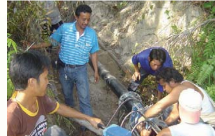
การประปาส่วนภูมิภาคสาขาเกาะพะงัน ปรับเปลี่ยนท่อ PE ขนาด 150 มม. ให้วางราบกับพื้น พร้อมติดตั้งชุดเครื่องสูบน้ำดิบบนแพลอยเพื่อสำรองไว้ใช้ในกรณีน้ำในคลองเหมืองชัยซึ่งเป็นแหล่งน้ำดิบหลักที่ใช้ในการผลิตน้ำประปาแห่งนี้ไม่สามารถสูบน้ำได้