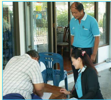
สาขาที่ 69 สาขาสามพราน