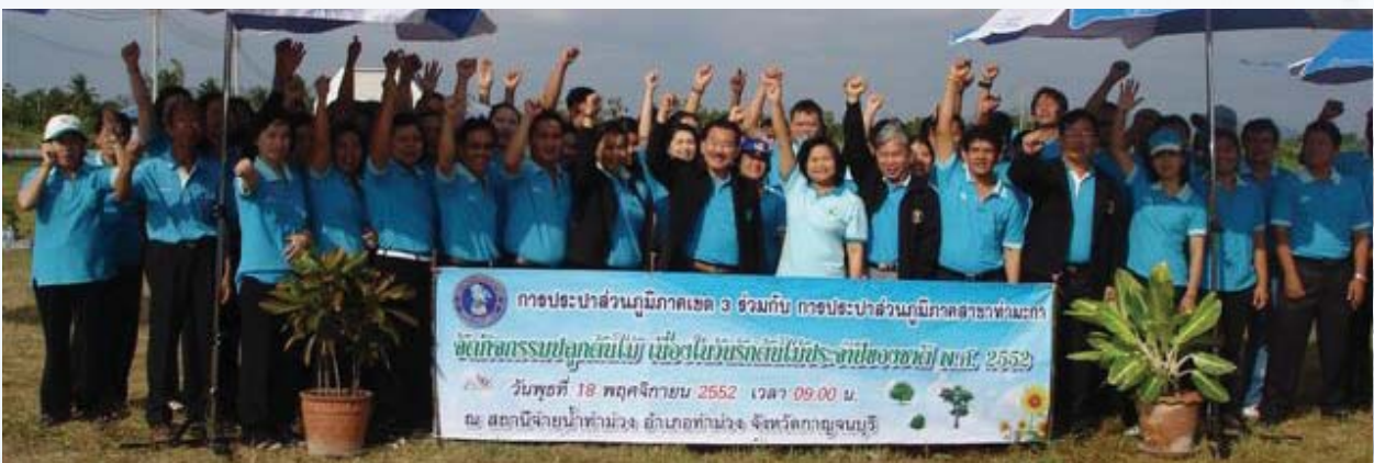
ปลูกต้นไม้ การประปาส่วนภูมิภาคเขต 3 ร่วมกับการประปาส่วนภูมิภาคสาขาท่ามะกา จัดกิจกรรมเนื่องใน "วันรักต้นไม้แห่งชาติประจำปี 2552" จำนวน 83 ต้น และปล่อยพันธุ์ปลาจำนวน 500 ตัวตามโครงการปรัชญาเศรษฐกิจพอเพียง บริเวณสถานีผลิตน้ำท่าม่วง อ.ท่าม่วง จ.กาญจนบุรี เมื่อวันที่ 18 พฤศจิกายน 2552

ด้วยศักยภาพการดำเนินงานด้าน CSR ของ กปภ. วารสาร "น้ำ" เชื่อว่า วันนี้ กปภ.พร้อมที่จะก้าวไปตามเจตนารมณ์อันแน่วแน่เพื่อดำเนินกิจกรรมเพื่อสังคมและสิ่งแวดล้อมต่าง ๆ อันจะยังประโยชน์และสร้างคุณค่าที่ดีให้แก่สังคมไทย เพื่อให้เป็นสังคมที่น่าอยู่ตลอดไป