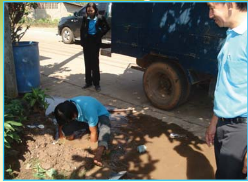
สาขาที่ 91 สาขาจันทร์ลักษ์