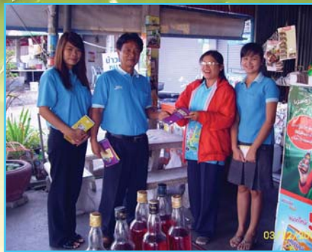
สาขาที่ 80 สาขาบ้านไผ่