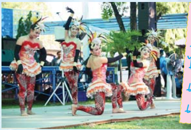
เขต 2 ลอยและ เซ็กซี่แบบชี เฮา ไปเลอราอวลัษณะ เลิศประกวดแดน เซอร์

ต่อจากนั้นเป็นการประกวดแดนเซอร์ ซึ่งทีมที่ เต้น เต้น เต้น ด้วยลีลาได้สุดยอด น่ารัก และประทับใจคนดูและ ถูกใจกรรมการมากที่สุด เป็นทีมจาก กปภ.เขต 2 สระบุรี ตามมาด้วยส่วนกลาง และ กปภ.เขต 6 ขอนแก่น ตามลำดับ