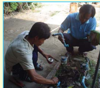
สาขาที่ 97 สาขาลาดยาว