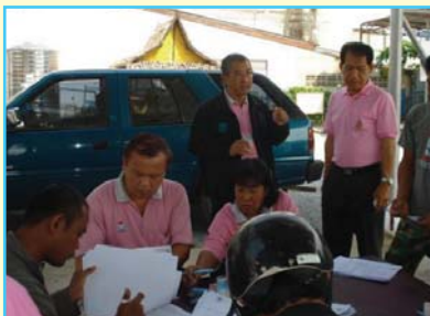
สาขาที่ 71 สาขาเลาขวัญ