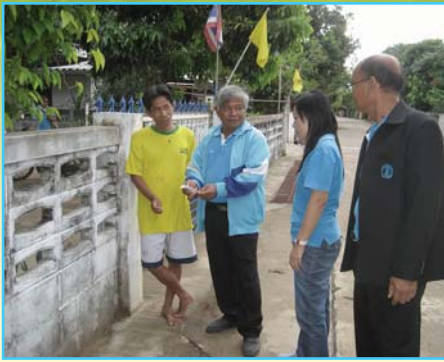
สาขาที่ 89 สาขามหาชนะชัย