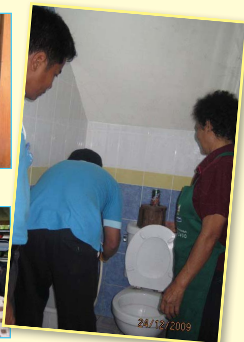
สาขาที่ 77 สาขาพัทลุง