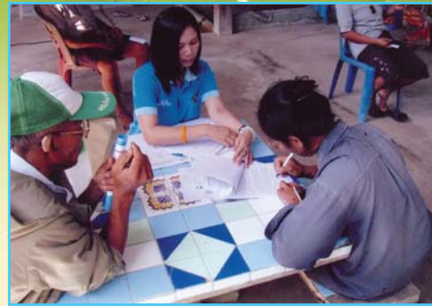
สาขาที่ 66 สาขาโนนสูง