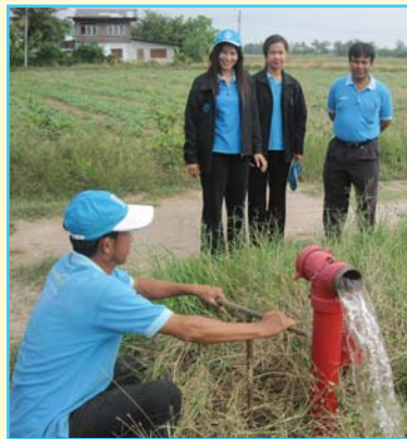
สาขาที่ 68 สาขาปากท่อ