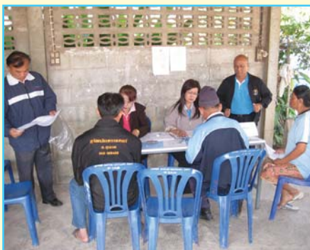
สาขาที่ 81 สาขาชุมแพ