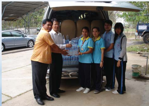
การประปาส่วนภูมิภาคเขต 10 สนับสนุนน้ำดื่ม จำนวน 432 ขวดให้แก่โรงพยาบาลสวรรค์ประชารักษ์ จ.นครสวรรค์ เพื่อสนับสนุนการจัดงานมหกรรมรักสุขภาพ ครั้งที่ 8