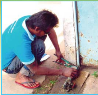
สาขาที่ 65 สาขาปักธงชัย