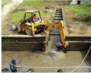
การประปาส่วนภูมิภาคสาขาทุ่งสง ชุดลอกทรายในรางชักน้ำดิบและบ่อสูบน้ำดิบเพื่อเพิ่มประสิทธิภาพในการผลิตน้ำ และแก้ปัญหาภัยแล้งในกรณีน้ำไหลเข้าบ่อสูบน้ำดิบไม่ทัน