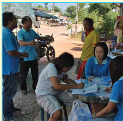
สาขาที่ 59 สาขาปากน้ำประแสร์