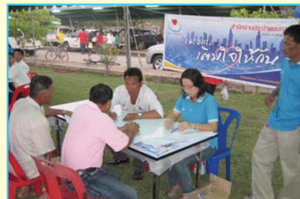
สาขาที่ 72 สาขาพนมทวน