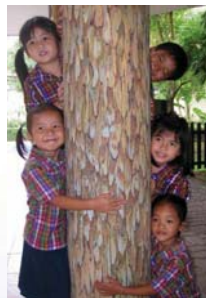
เด็กนักเรียนของโรงเรียนลำปลายมาศพัฒนา กับความเป็นไทย