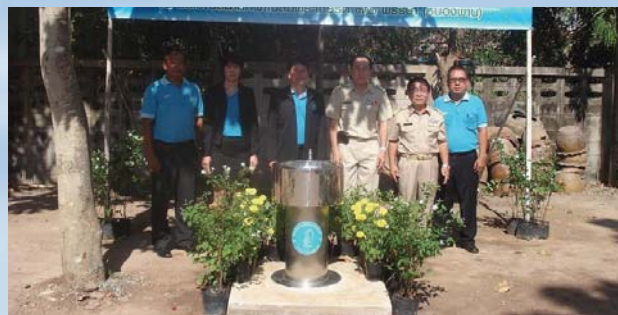
ตั้งจุดประปาดื่มได้ การประปาส่วนภูมิภาคสาขาพนมสราคม ร่วมกับสำนักงานเทศบาลตำบลพนมสราคม ติดตั้งน้ำประปาดื่มได้จุดที่ 2 ภายในสนามกีฬาเฉลิมพระเกียรติ (หนองพาน) เพื่อให้บริการประชาชนที่มาพักผ่อนและออกกำลังกาย