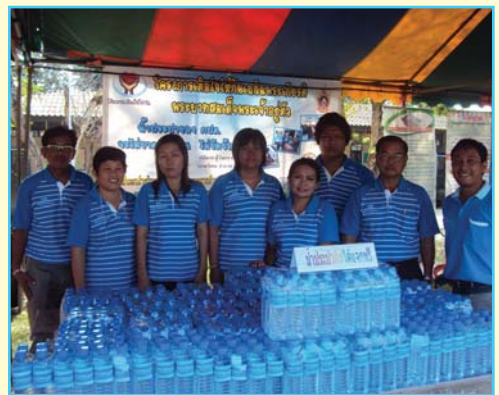
สาขาที่ 60 สาขาปราจีนบุรี