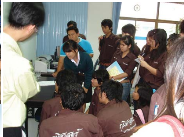
การประปาส่วนภูมิภาคสาขาพะเยา ให้ความรู้เกี่ยวกับระบบ GIS แก่นักศึกษามหาวิทยาลัยนเรศวร จ.พะเยา ที่มาศึกษาดูงาน เมื่อวันที่ 13 มกราคม 2553