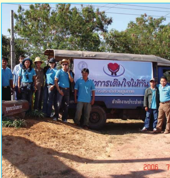
สาขาที่ 87 สาขาด่านซ้าย