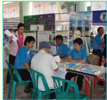
สาขาที่ 94 สาขาแม่สาย