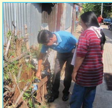
สาขาที่ 83 สาขาเมืองพล