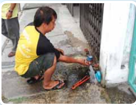
สาขาที่ 138 สำนักงานประปَاب้านบึง