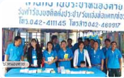
ป.หนองคาย