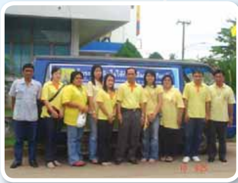
สาขาที่ 144 สำนักงานประปาชุมพร