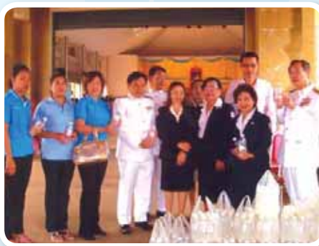
สาขาที่ 139 สำนักงานประปาอรัญประเทศ