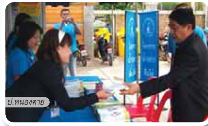
ป.หนองคาย