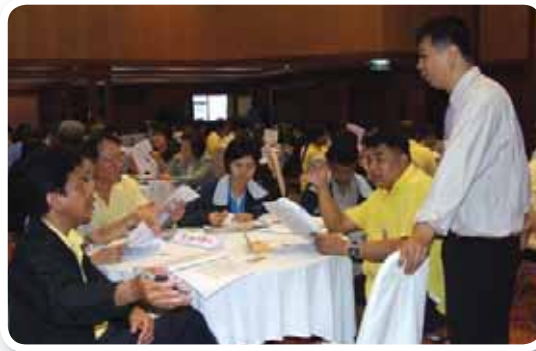
วิเคราะห์ ผู้บริหารในสังกัดสำนักงานประปาเขต 6 ร่วมสัมมนาเชิงปฏิบัติการเพื่อวิเคราะห์สมรรถนะความสามารถของพนักงานรายบุคคล (Competency) ที่โรงแรมขอนแก่นโฮเทล