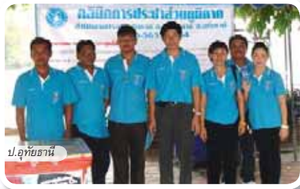
ป.อุทัยธานี