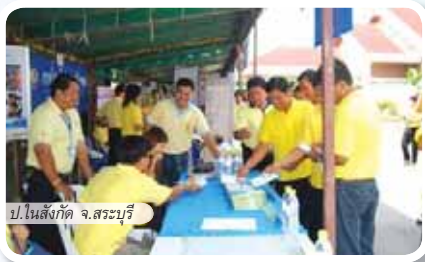
ป.ในสังกัด จ.สระบุรี