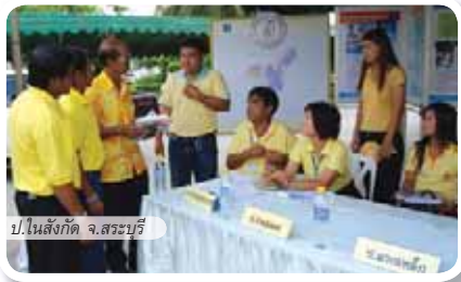
ป.ในสังกัด จ.สระบุรี