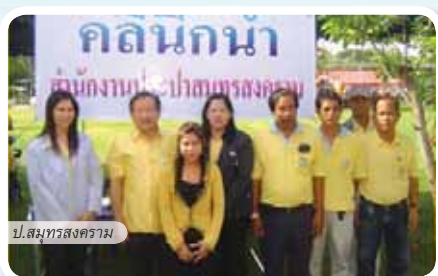
ป.สมุทรสงคราม