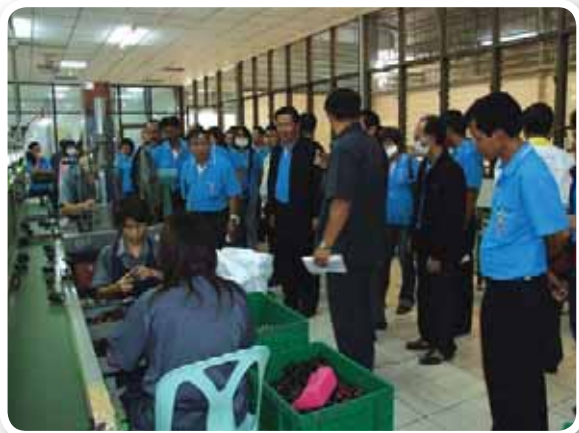
ดูงาน ผู้บริหารและพนักงานในสังกัดสำนักงานประปาเขต 8 เยี่ยมชมและดูงานที่โรงงานของบริษัทยูเอชเอ็มกรุ๊ป อ.กบินทร์บุรี จ.ปราจีนบุรี