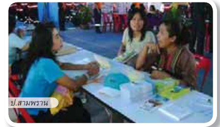
ป.สามพราน