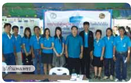
ป.กำแพงเพชร