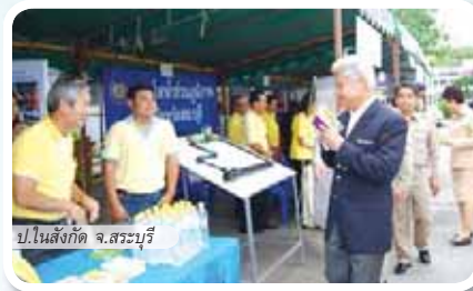
ป.ในสังกัด จ.สระบุรี