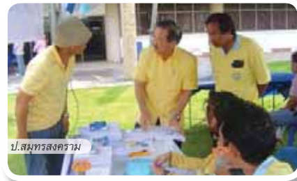
ป.สมุทรสงคราม