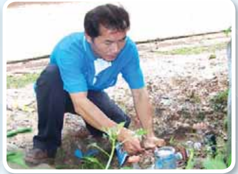
สาขาที่ 158 สำนักงานประปาศรีสงคราม