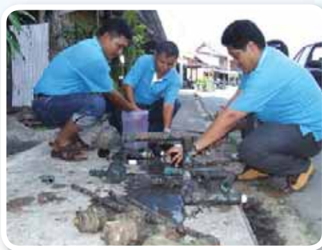
สาขาที่ 148 สำนักงานประปากันตัง