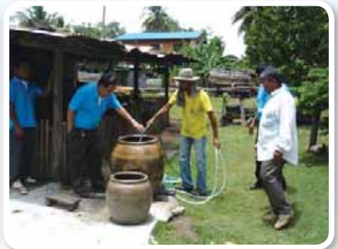
สาขาที่ 161 สำนักงานประปาศรีบุญเรือง