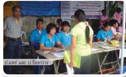
ป.แพร่ และ ป.ร้องกวาง