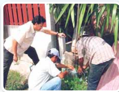
สาขาที่ 149 สำนักงานประปamahasarakham