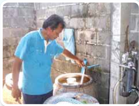
สาขาที่ 159 สำนักงานประปาเดชอุดม