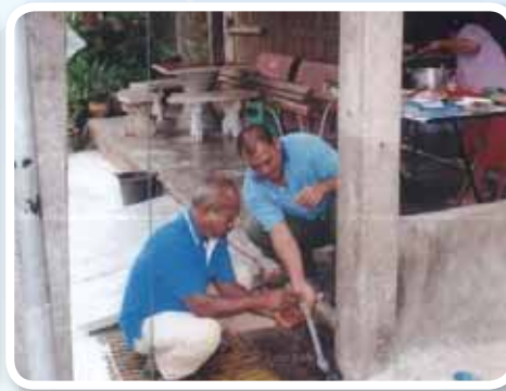
สาขาที่ 146 สำนักงานประปาชะอวด