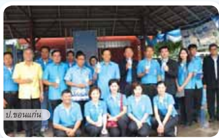
ป.ขอนแก่น