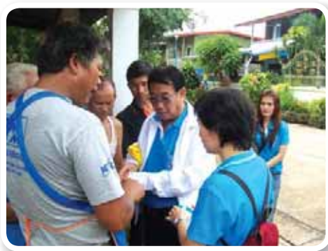
สาขาที่ 153 สำนักงานประปาอุดรธานี