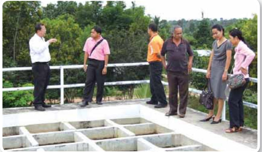
ตรวจสอบ เจ้าหน้าที่จากศูนย์อนามัยที่ 7 และสำนักงานสาธารณสุข จ.อุบลราชธานี ตรวจสอบระบบผลิตน้ำประปาที่โรงกรองน้ำ สำนักงานประปาเดชอุดม ก่อนการรับรองเป็นพื้นที่น้ำประปาดื่มได้