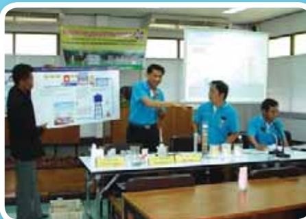
ประสาน สำนักงานประปาเขต 10 ร่วมกับ สำนักงานประปาชัยนาท เริ่มดำเนินการตามโครงการบันทึกข้อตกลงร่วมในการบูรณาการภารกิจ โดยร่วมประชุมโครงการความร่วมมือ ณ ที่ทำการองค์การบริหารส่วนตำบลมะขามเฒ่า อ.วัดสิงห์ จ.ชัยนาท เพื่อให้การดำเนินงานเป็นไปอย่างต่อเนื่องและสอดคล้องกับนโยบายรัฐบาล