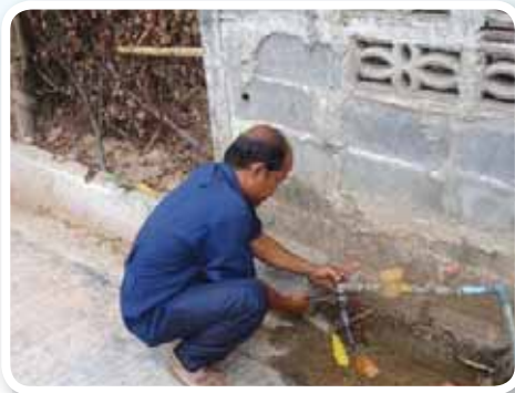
สาขาที่ 160 สำนักงานประปาสดึก