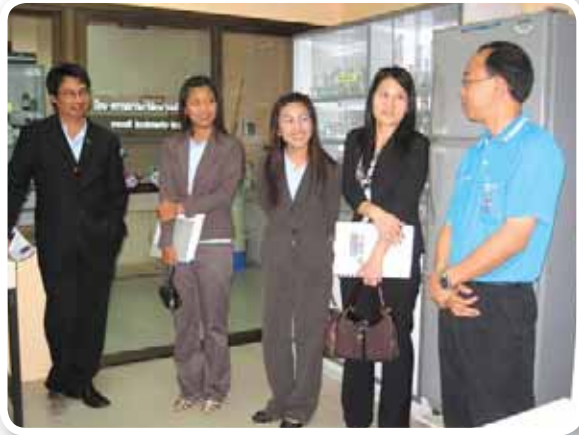
เยี่ยมชม สำนักงานคณะกรรมการนโยบายรัฐวิสาหกิจ (สคร.) และบริษัท TRIS เข้าชมระบบการดำเนินงานของสำนักงานประปาเขต 1