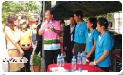
ป.อุทัยธานี