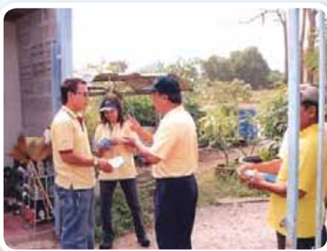
สาขาที่ 141 สำนักงานประปาบ้านหม้อ