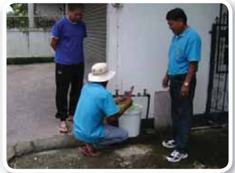
สาขาที่ 164 สำนักงานประปามุกดาหาร