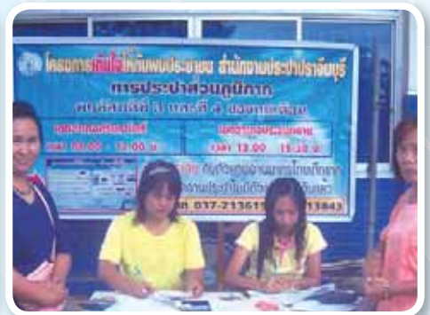
สาขาที่ 140 สำนักงานประปาปราจีนบุรี