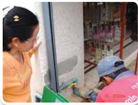
สาขาที่ 162 สำนักงานประปารัตนบุรี