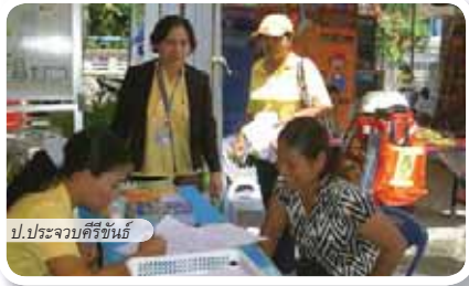
ป.ประจวบคีรีขันธ์