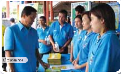
ป.ขอนแก่น