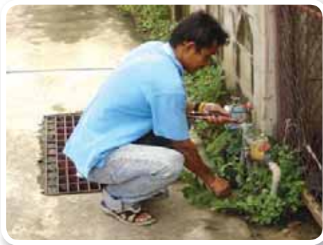
สาขาที่ 165 สำนักงานประปาตะพานหิน