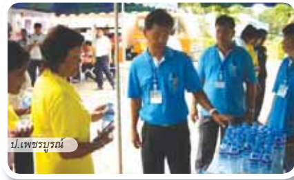
ป.เพชรบูรณ์