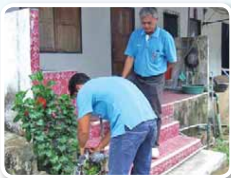
สาขาที่ 147 สำนักงานประปาสะเตา