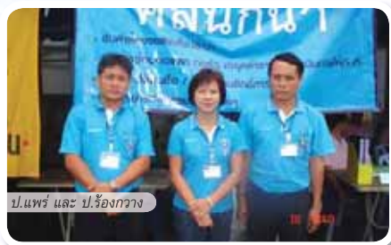
ป.แพร่ และ ป.ร้องกวาง