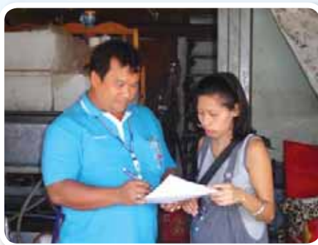
สาขาที่ 142 สำนักงานประปาพระนครศรีอยุธยา