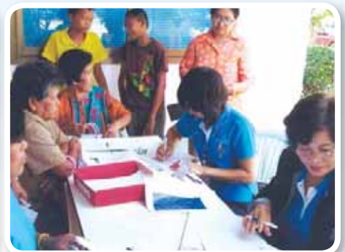
สาขาที่ 143 สำนักงานประปาปักธงชัย