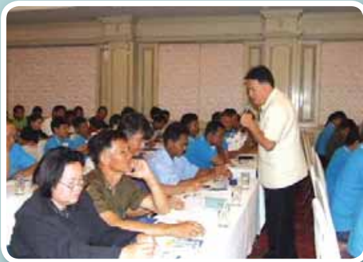
เติมหัวใจ สำนักงานประปาเขต 6 จัดการอบรม “เติมน้ำใจใส่น้ำประปา เพิ่มมูลค่าด้วยการเติมหัวใจใสบริการ” ที่โรงแรมขอนแก่นโฮเทล เพื่อมุ่งพัฒนาบุคลากรให้เป็นผู้มีทัศนคติและพฤติกรรมที่เป็นเลิศด้านการบริการ