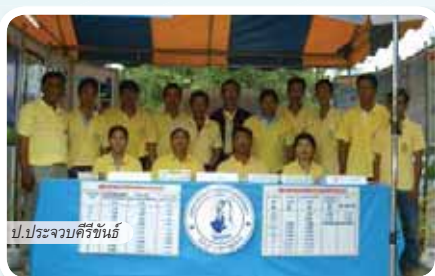
ป.ประจวบคีรีขันธ์