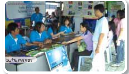
ป.กำแพงเพชร