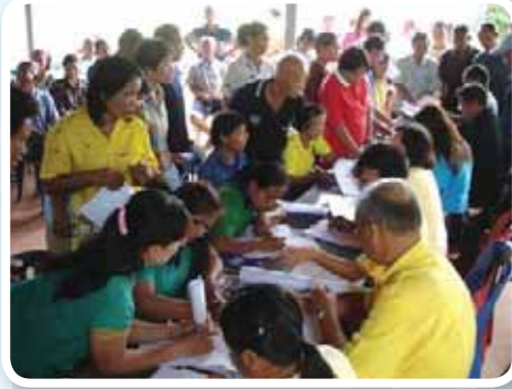
สาขาที่ 157 สำนักงานประปาพังโคน