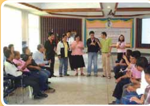
อบรม สำนักงานประปาเขต 7 ร่วมกับบ้านพักใจอุดรธานี และสำนักงานสวัสดิการและคุ้มครองแรงงาน จ.อุดรธานี จัดอบรมพนักงานและลูกจ้างในสังกัด ตามโครงการป้องกันและบริหารจัดการด้านเอดส์ในสถานประกอบการ ปี 2551