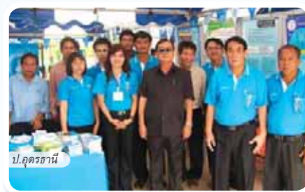
ป.อุดรธานี