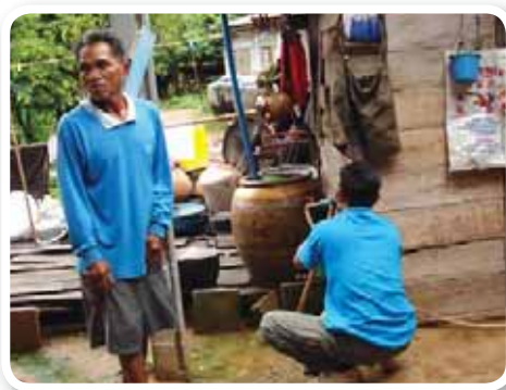
สาขาที่ 151 สำนักงานประปาหนองบัวแดง