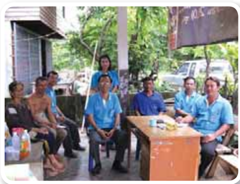
สาขาที่ 150 สำนักงานประปาบำเหน็จณรงค์