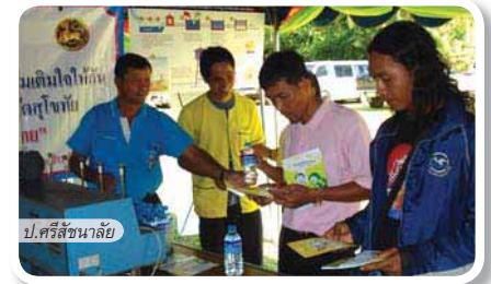
ป.ศรีษะนาถ