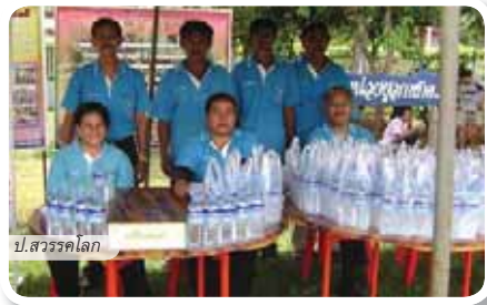
ป.สรวงโลก