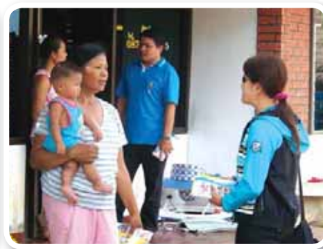
สาขาที่ 155 สำนักงานประปาหนองบัวลำภู