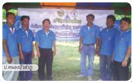
ป.หนองบัวลำภู