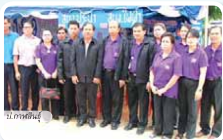
ป.กาฬสินธุ์