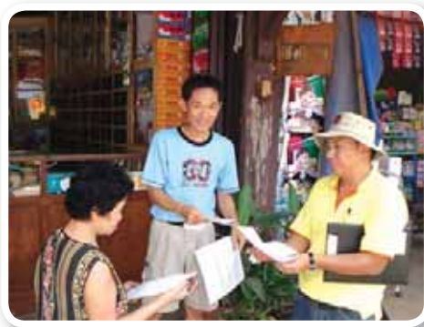
สาขาที่ 154 สำนักงานประปากุมภวาปี