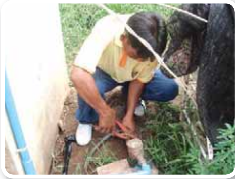
สาขาที่ 163 สำนักงานประปากันทรลักษณ์