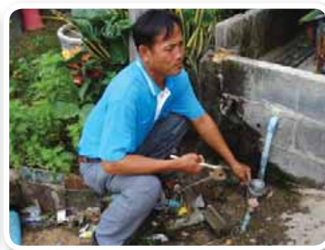
สาขาที่ 152 สำนักงานประปาสวรรณภูมิ