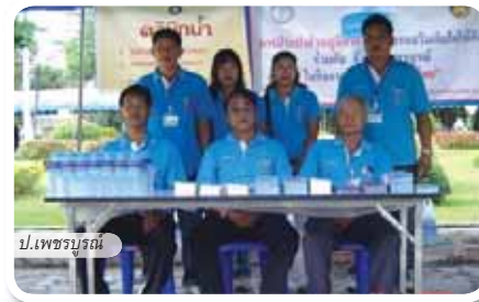
ป.เพชรบูรณ์