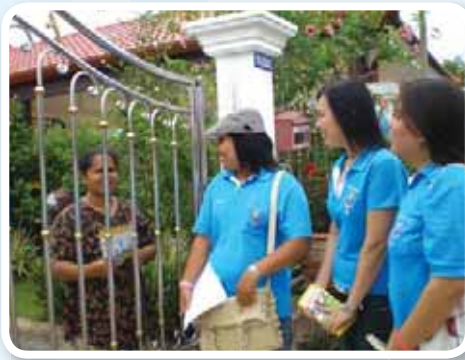
สาขาที่ 145 สำนักงานประปาภูเก็ต