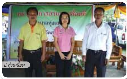
ป.ทุ่งสเลียม