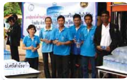
ป.ศรีสะเกษ