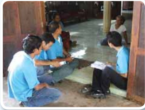
สาขาที่ 156 สำนักงานประปาสกจนคร